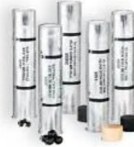
37/40MM DUAL RIM

MULTIPLE PROJECTILE Single Rubber Baton Model # 2550 Sting-Ball .31 Cal. Model # 2552 Sting-Ball HV .31 Cal. Model # 2553 Sting-Ball .60 Cal. Model # 2555 SINGLE PROJECTILE Super-Sock® Model # 2581