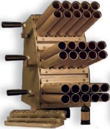
VENOM™ HIGH CAPACITY VARIABLE PAYLOAD LAUNCHING SYSTEM

نظام الإطلاق CTS VENOM يسهل تركيبه على منصات عديدة، وتشمل السفن الحربية والمركبات البرية ومواقع المراقبة الثابتة.