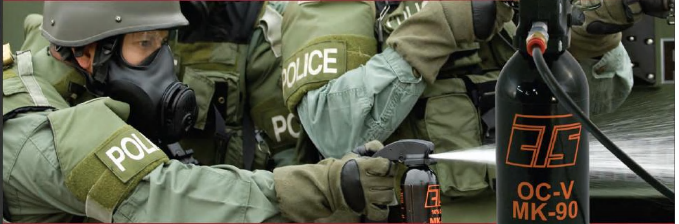
OC Vapor System Model 1947HW

أجهزة الدخان الضبابي ومرفقاتها للدوريات والعمليات التكتيكية والتحكم وإدارة التجمعات وضباط التدخل. الدخان الضبابي للدفاع المقدم من CTS هي الخيارات الأولى في المواجهات الفورية ومواجهة الأفراد المشاغبين أثناء عمليات الدوريات وعمليات التدخل. تقوم CTS بإنتاج مجموعة متنوعة من التركيبات ، أحجام الوحدة، وطرق التسليم.